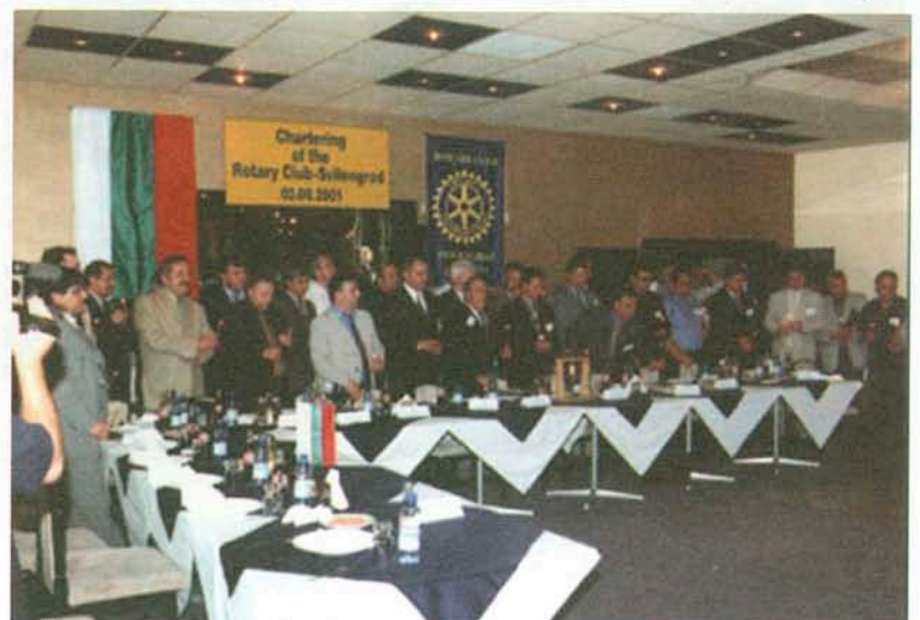
Ротарианците от Свиленград и официалните гости